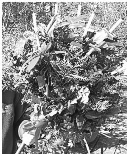
Palmen, wie sie in Dotternhausen Tradition sind wurden zur Weihe in der Kirche abgelegt