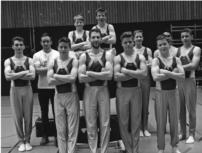
Mit einem starken Team sehen wir dem Ligafinale in Ludwigsburg entgegen