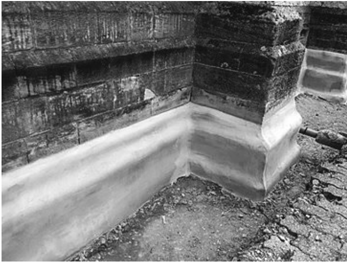
Fundamentsteine sind nun großflächig verputzt

Doch vergangenen Montag war es so weit. Der flächig aufzutragende Putz konnte angebracht werden. Die Fundamentsteine sind nicht mehr sichtbar und warten nach einer Trocknungsphase auf die letzte wasserabweisende Deckschicht.