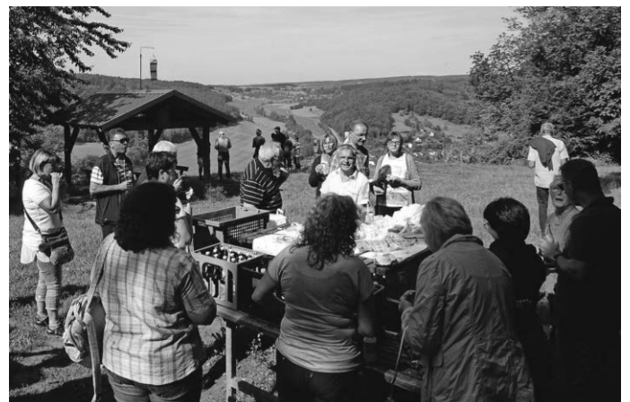
Stärkung zu Beginn der Wanderung