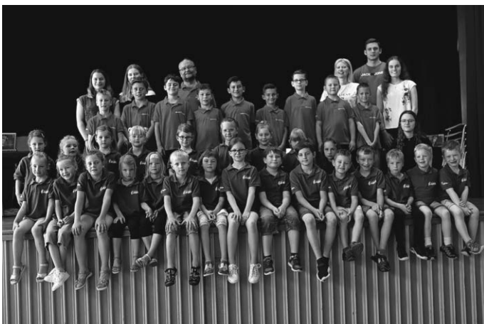
Gruppenbild aller jungen Akteure mit ihren musikalischen Ausbildern