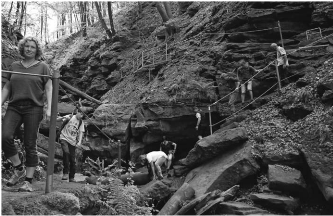
In der Margarethen-Schlucht