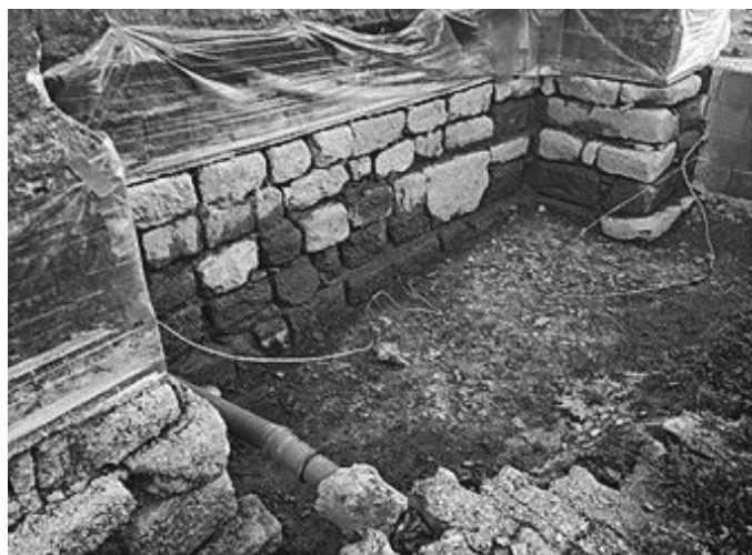
Grundierung der Fundamente

Nach dem aufwändigen Reinigen der Fundamente, konnte nach ein paar Trocknungstagen, die Grundierung der Fugen und Steine erfolgen. Im Bild noch gut sichtbar, wie die Fundamente Stein auf Stein im Jahr 1885 aufgeschichtet wurden.