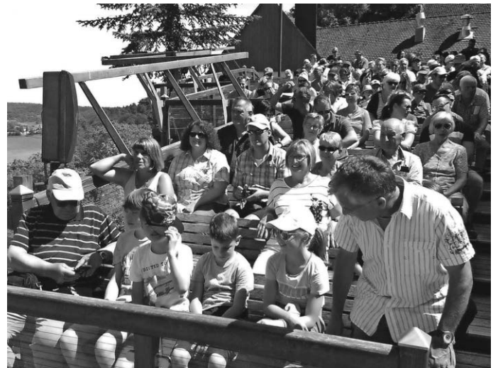
Warten auf die Flug-Schau auf der Burg Guttenberg

14. Juni Einkehr-Schwung 22./23. Juni Fernwanderung 30. Juni Familienwanderung Unterkirnach 4. Juli Ausschuss-Sitzung