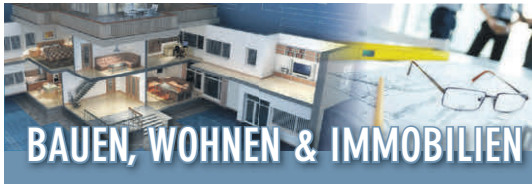
Ungerade KW*: in Pattonville