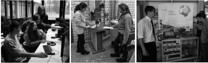
Berufsvorbereitung | Hauptschulabschluss | Ausbildung | Mittlerer Bildungsabschluss | Fachhochschulreife | Abitur | Weiterbildung

Die Philipp-Matthäus-Hahn-Schule Balingen lädt ein zum Infotag am Freitag, 7. Februar 2025, von 8 bis 16 Uhr.