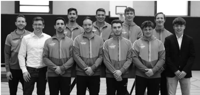
Das Landesliga-Team der SVD-Turner